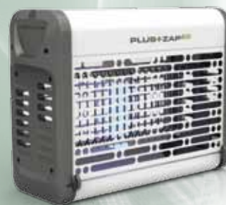
PlusZapEco 20W Blanco