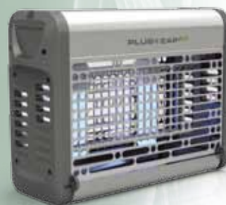
PlusZapEco 40W Acero Inox